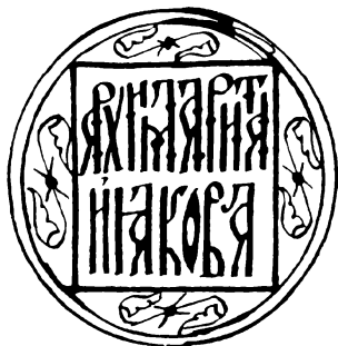
Книжный знак (заказчика) и владельца книги архимандрита костромского Ипатьевского монастыря Иякова (1597—1606) на Егоровской рукописи.

Знаки «архимарита Иякова» находятся в рукописных книгах, принадлежащих, судя по филиграням, к концу XVI в. В Рогожском сборнике молитв и канонов 2 это киноварный квадрат, вписанный в киноварное же кольцо, образованное двумя линиями, с наружным диаметром 54 см. Внутри квадрата надпись чернилами и вязью в две строки. Круг сделан циркулем и центр его также