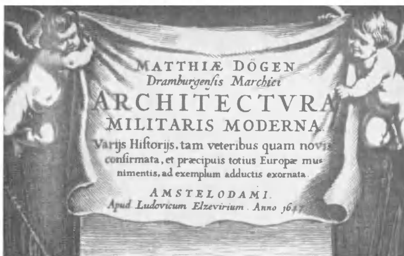
Титульный лист (заставка)

XVIII в., а латинский шрифт антиква. Вывод этот высказывается автором на основе привлечения двух дополнительных источников — отдельных примеров из изданий середины XVII и начала XVIII в. (гравированных образцов или набранных голландской антиквой). Однако такое, в основном верное, положение автора не выявляет еще органической природы русского гражданского шрифта.