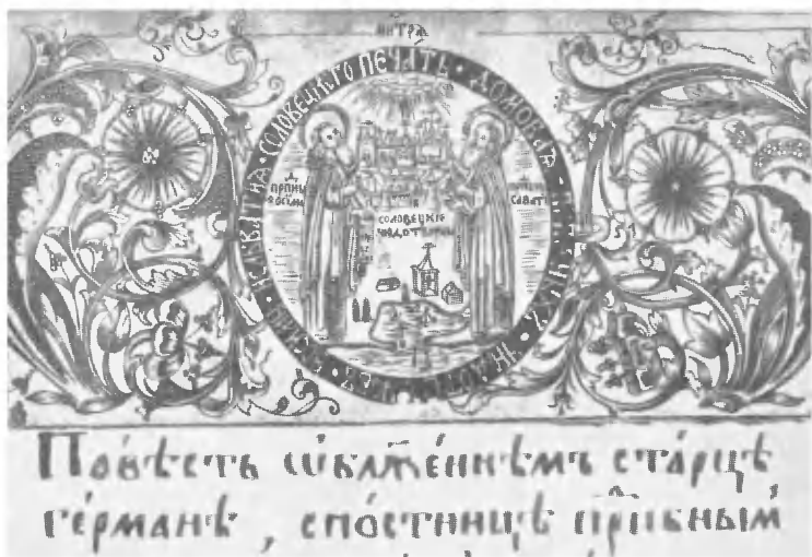
Гравированная на меди заставка рукописного Сборника XVII в. ЦГИА Карельской АССР, № 37.

ного строения пехотных людей» 1647—1649 гг., в свое время была описана Д. А. Ровинским 25 . Мы обнаружили часть этой рамки, использованную в качестве заставки, в рукописном Сборнике XVII в. из собрания Центрального государственного исторического архива Карельской АССР 26 .