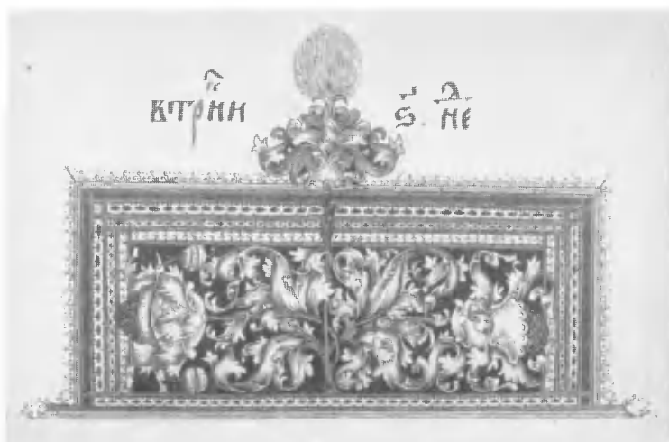
Рукописная заставка со старопечатным клеймом, варьирующим мотивы «Большого прописного алфавита» Израэля ван Мекенема.

встречается нам в Четвероевангелии 1531 г. Исаака Бирева, в Четвероевангелии Государственного исторического музея, в роскошном Апостоле 1540 г. из собрания Троице-Сергиевой лавры 16 .