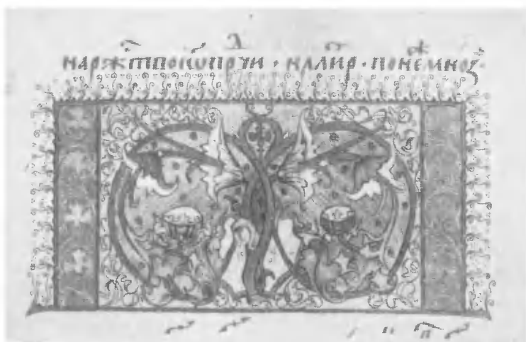
Заставка Феодосия Изографа из Четвероевангелия Кирилло-Белозерского монастыря. ГПБ, Кирил.-Бел. 37/42.