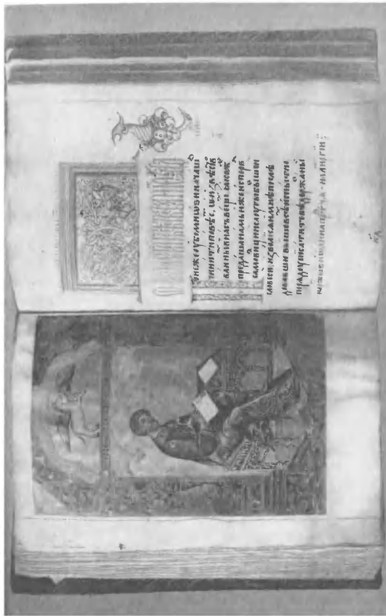
Разворот Уваровского Четвероевангелия с раскрытым ксилографическим фронтисписом и гравированными на металле заставкой и «цветком». ГИМ, Ув. 77